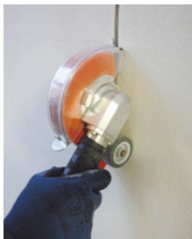
Crearea canalelor pentru cabluri electrice