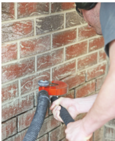
Poate taia pe suprafete, mari rapid si curat